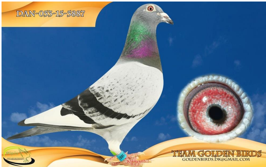
053-15-5887 Sektionsvinder Fra Lüneburg, søsteren sat i avlen efter gennemført ungeprogram 2015