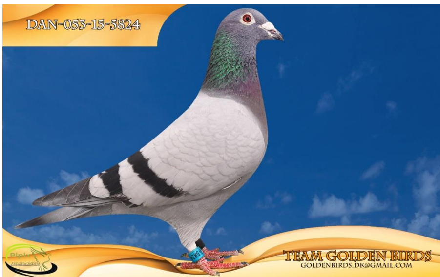
"Superwoman" Sektionsvinder fra Bremen 2018, samt 7,8 & 10 bedste es-due. 2 andele i DM-SPORT 2018