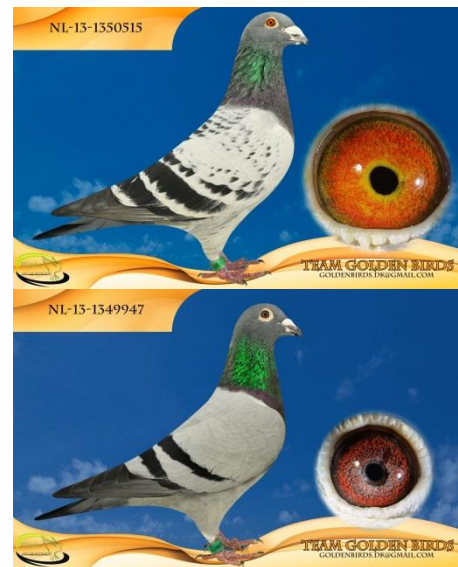
Faderen og moderen til "Supermann"