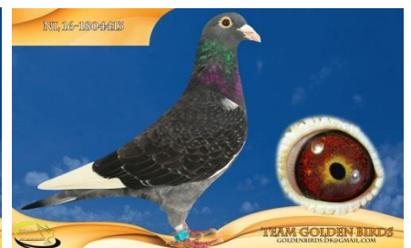
Flot Jan Arden han fra Bertus Timmer