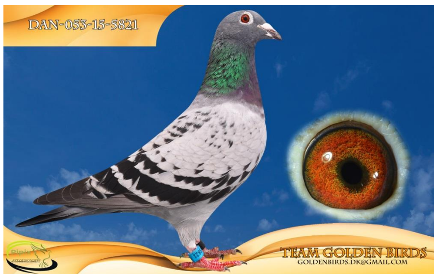
Regionsvinder fra Freiburg 1016 km nr. 6 national. 2 x sektionsvinder fra Freiburg 2018

Med hensyn til ungerens træning er devisen ”så mange gange som muligt, og så langt som muligt”. I praksis betyder dette træninger op til 85 kilometer, hvoraf flere gange i fællesskab med 7-8 andre slag. Normalvis gennemflyves ungerne på hele programmet, men i 2017 måtte denne fremgangsmåde dog indstilles på grund af et svært angreb af ungesyge.