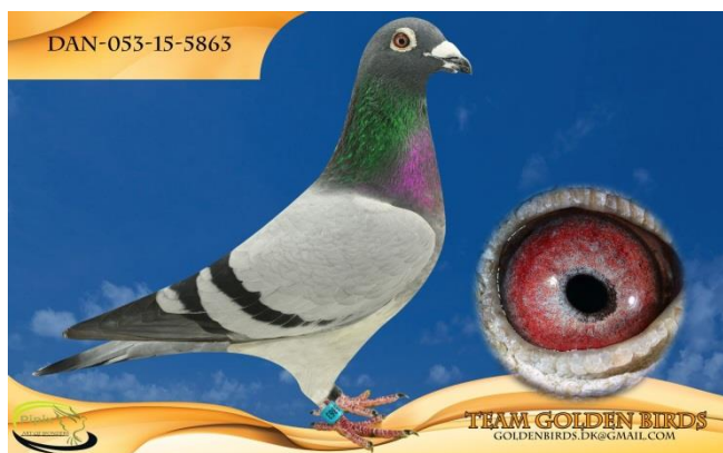
Sektionsvinder Bregninge kirke og senere es-due på langflyvning.