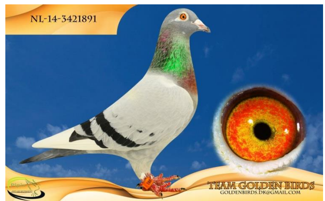
Moderen til 5811 "Super Mario" & 5812 "Pikadue"

I april 2014 avlede Brian på to duer fra Ruud hannen 4049. Faderen til 4049 var efter topduen "Blue Eagle 1" med 14 placeringer af 14 mulige på overnatningsflyvninger. Moderen til 840 var efter "840", som brilierede med 11 placeringer af 11 mulige på overnatningsflyvninger, så de genetiske forudsætninger for 4049 til at klare sig på de vanskeligste flyvninger var på plads fra starten. Allerede i sit fødeår – og trods sit sene fødselstidspunkt, måtte 4049 gennemflyve hele ungeprogrammet. Denne opgave klarede han fint, og som 1-års deltog han på samtlige 5 endagslangflyvninger og var placeret i sektionen på de 3 længste af dem. De 3 flyvninger talte Essen, Giessen og Dresden, og for dem, der stadig husker Essen-flyvningen i 2015, vil de vide, at dette var en flyvning, "hvor fårene blev skilt fra bukkene", og duerne måtte kæmpe med overskyet vejr og høje varmegrader. Brian husker stadig, at han i denne weekend opholdt sig i Hamburg og på egen krop kunne mærke udfordringen. En virkelig toppræstation af en 1-års due. 4049 fik derefter en karriere på de superlange flyvninger, hvor han udmærkede sig med sektionsplaceringerne 2-2-3-3-4, inden han desværre blev mistet. Faderen og moderen til 053-14-4049 ses afbilledet herunder.