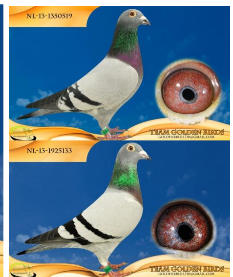
Faderen og Moderen til "Superboy & 5830"