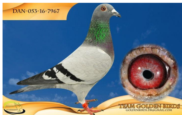
Sektionsvinder fra Tønder efter par 14.