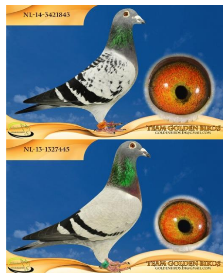
Faderen og moderen til 053-15-5821