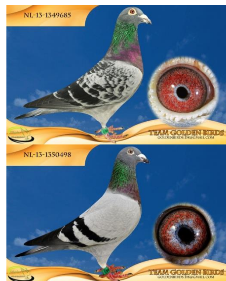
Faderen og moderen til "Superwoman"

Det kan i øvrigt tilføjes, at Brian er en ægte "all-round" brevduemand, som flyver hele programmet med det ene mål at vinde flyvningerne. De syv sektionsvindere breder sig over flyvninger på ca. 200 km og op til Freiburg på den gode side af 1000 km.