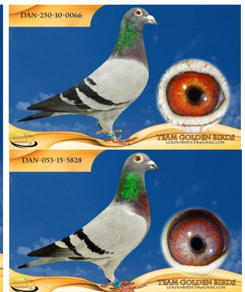
Faderen og moderen til "Supergirl"