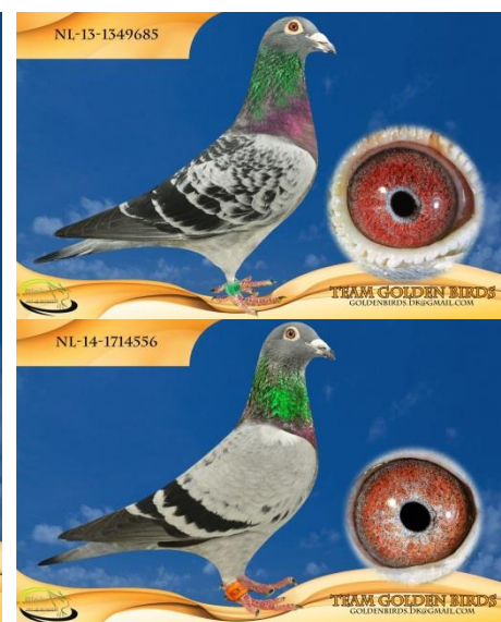
Faderen & Moderen til 000-16-6146