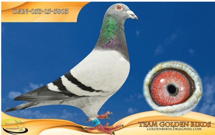
"Supermann" 3 x Sektionsvinder i karrieren, samt 1,2,4 & 5 bedste es-due. 4 andele i DM.