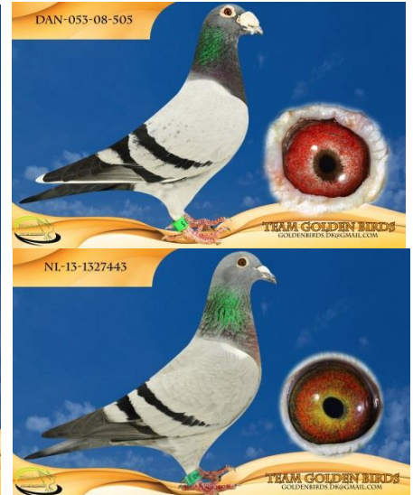
Faderen "505" og moderen til 5887 & 5888

Sejrsrækken fortsatte i opadgående retning i 2017, hvor der landede 2 sektionsvindere, bl.a. på kongeflyvningen fra Antwerpen, ligesom langflyvermesterskabet på sport blev sikret sammen med en fornem andenplads til det åbne langflyvermesterskab. Det blev også i 2017 til en placering som nr. 3 til sportsmesterskabet på mellemdistancen og en flot 13.-plads til DM Sport. Sidst, men ikke mindst, vandt hannen "Superman" ES-due konkurrencen på mellem sport i DdB-regi, mens det også i DdB-regi blev til to fornemme andenpladser i ES-due konkurrencerne for hanner og hunner på langdistancen.