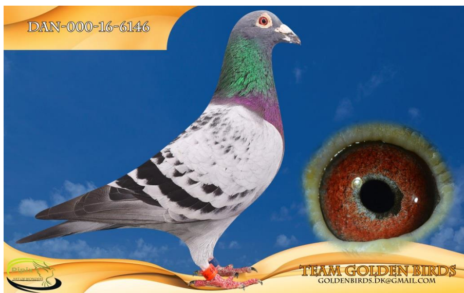
000-16-6146 Sektionsvinder fra Altona 2018, Halvbror til "Superwoman"