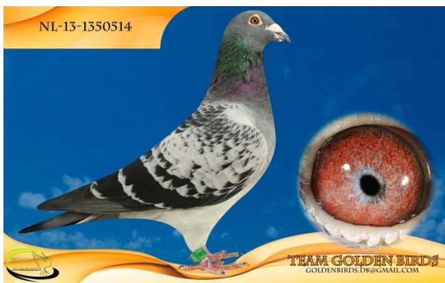
Faderen til 5811 "Super Mario" & 5812 "Pikadue"