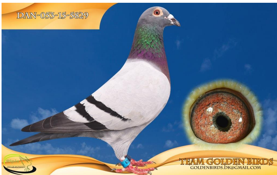
"Superboy" 1 es-due langdistance med 5 plac af 5 mulige (3-3-5-7-12), 3 andele i DM-SPORT 2018