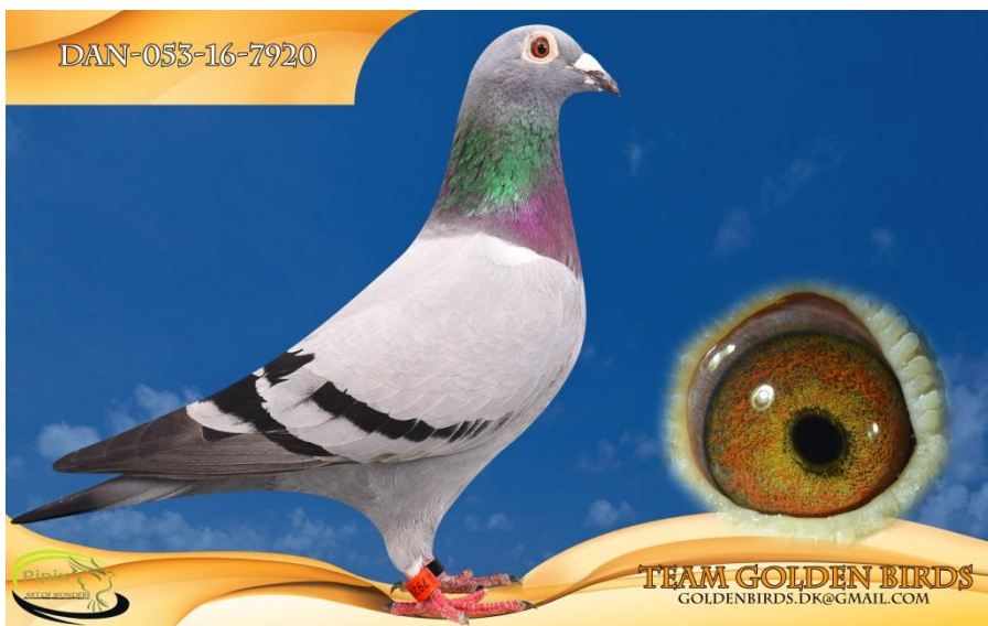
"Supergirl" som har 22 placeringer, 4,4,9 & 13 es-due, samt 2 andele i DM-SPORT 2018