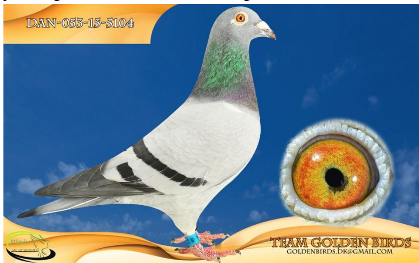
Sektionsvinderen fra Altona unger i 2015, Helsøster til mesterskabsdue og es-due på lang i 2017